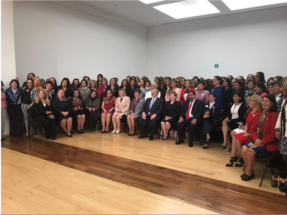
288 JUZGADORAS DEL PAÍS EN LA "CONSTITUCIÓN DEL CAPÍTULO MÉXICO DE LA ASOCIACIÓN INTERNACIONAL DE MUJERES JUEZAS"